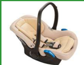
Автокресло группы 0+ для детей массой менее 13 кг