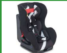
Автокресло группы I для детей массой 9-18 кг